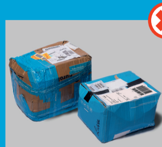
Huonosti paketoituidut paketit, jotka muuten kelpaisivat koneelliseen lajitteluun