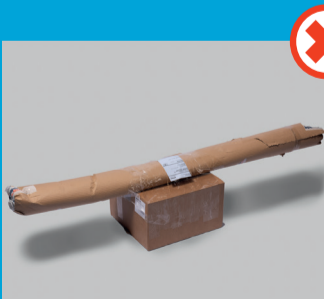
Yhteen sidotut eri muotoiset pakkaukset