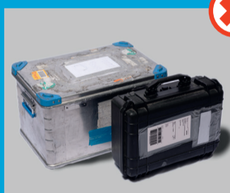
Metalli-, puu- tai muovisalkut