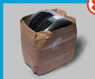
Renkaat ja vanteet