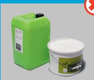
Kanisterit ja ämpärit

Seuraavassa on esimerkkejä paketeista, joita ei voida lajitella koneellisesti ja joista voi mennä lisämaksua käsin lajittelun takia: