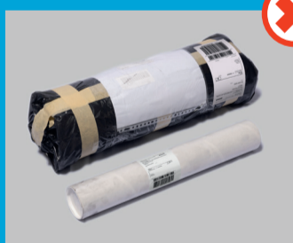
Rullat ja putket