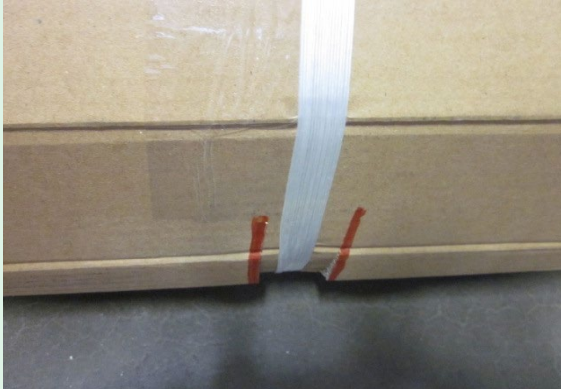
Kuvassa umpinainen sivu.