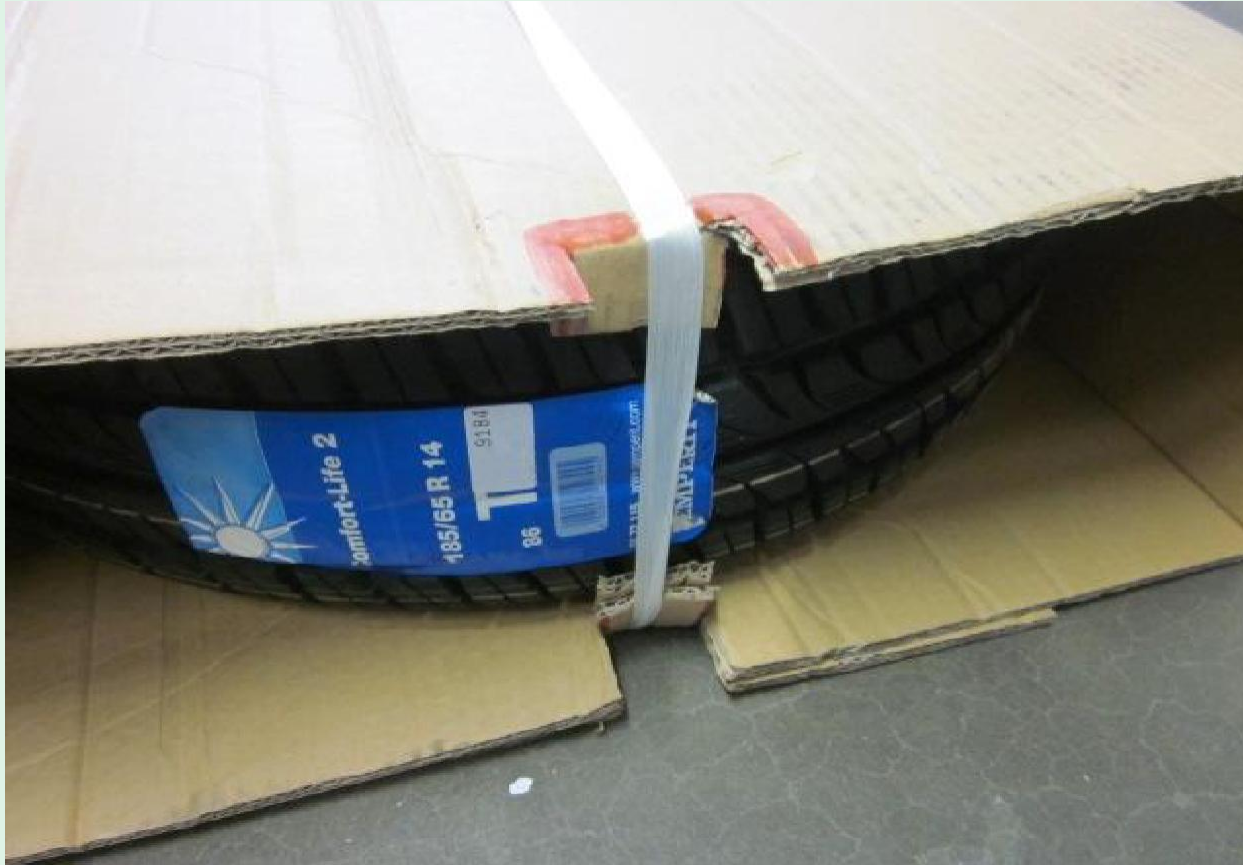
Kuvassa avoin sivu.